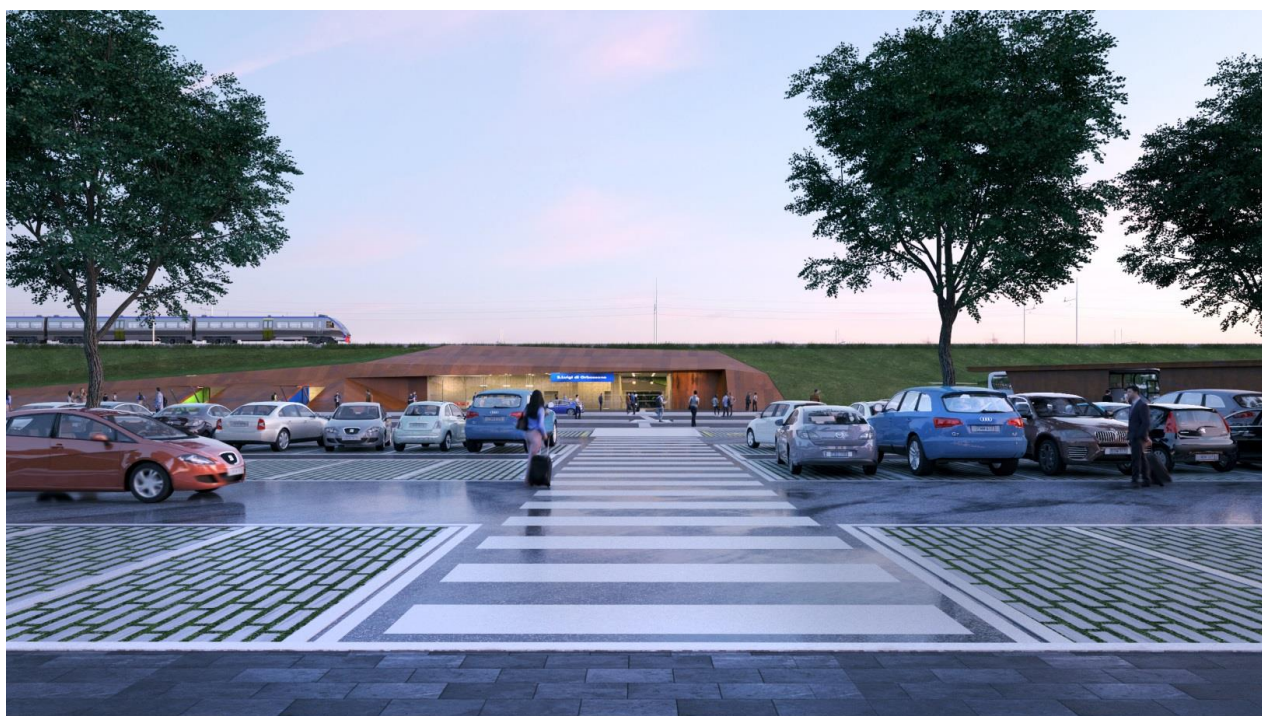
Fig.2 – render architettonico: vista del fabbricato viaggiatori ipogeo dal Movicentro

La soluzione trovata per FM5, nell'ambito dell'Osservatorio per la Torino-Lione, è un esempio di "buona amministrazione", di collaborazione tra Enti, di lavoro comune, di senso delle istituzioni nell'interesse delle Comunità.